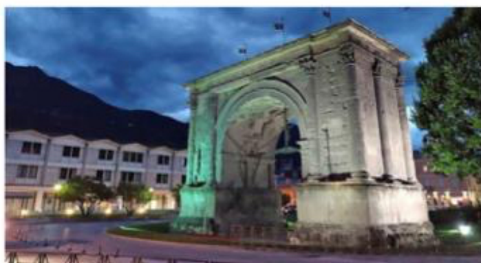
De Poort van (de Romeinse keizer) Augustus staat nog fier overeind.