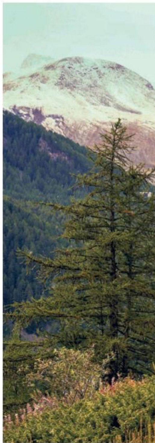
Dankzij de e-mountainbikes kunnen ook gewone fietsende stervelingen de bergen van Valle D'Aosta verkennen.

geserveerd met een saus van Fontina – de kaas die de grote trots van deze regio is. Het menu is beperkt: geen thee, wel koffie. Geen frisdrank, wel sap. Rode én witte huiswijn ontbreken dan weer niet.