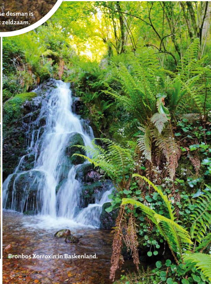
Bronbos Xorroxin in Baskenland.