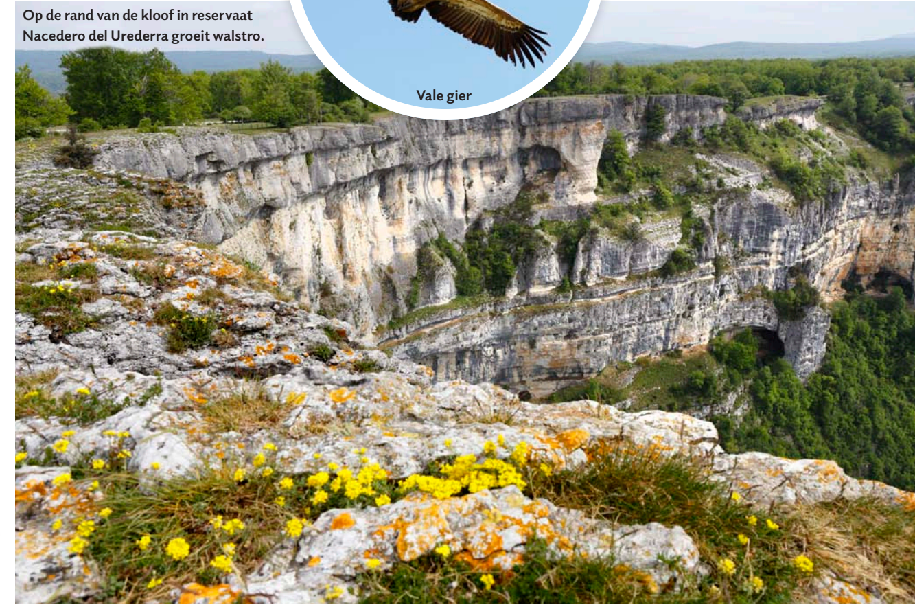
Op de rand van de kloof in reservaat Nacedero del Urederra groeit walstro.