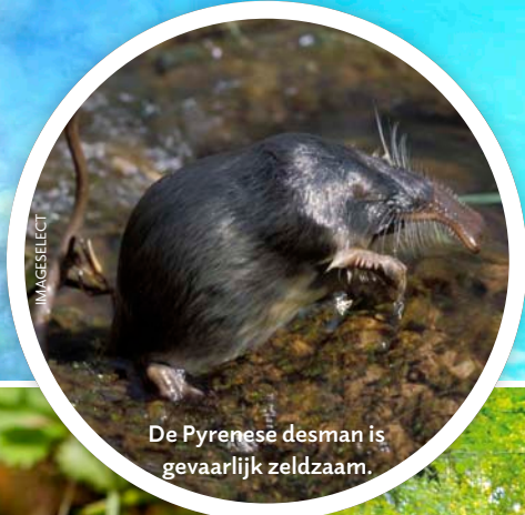
De Pyrenese desman is gevaarlijk zeldzaam.