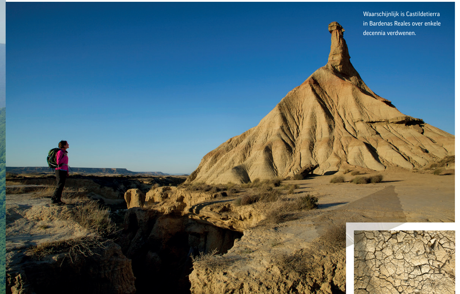
Waarschijnlijk is Castildetierra in Bardenas Reales over enkele decennia verdwenen.

In het noorden van Spanje schittert de ruwe diamant Navarra. In dit voormalige koninkrijk vind je geen strand, geen zee en luierende lijven maar wél mooie hikepaden, de noordelijkst gelegen halfwoestijn, een van de grootste beukenbossen van Europa en niet te vergeten een verfijnde Spaanse keuken.