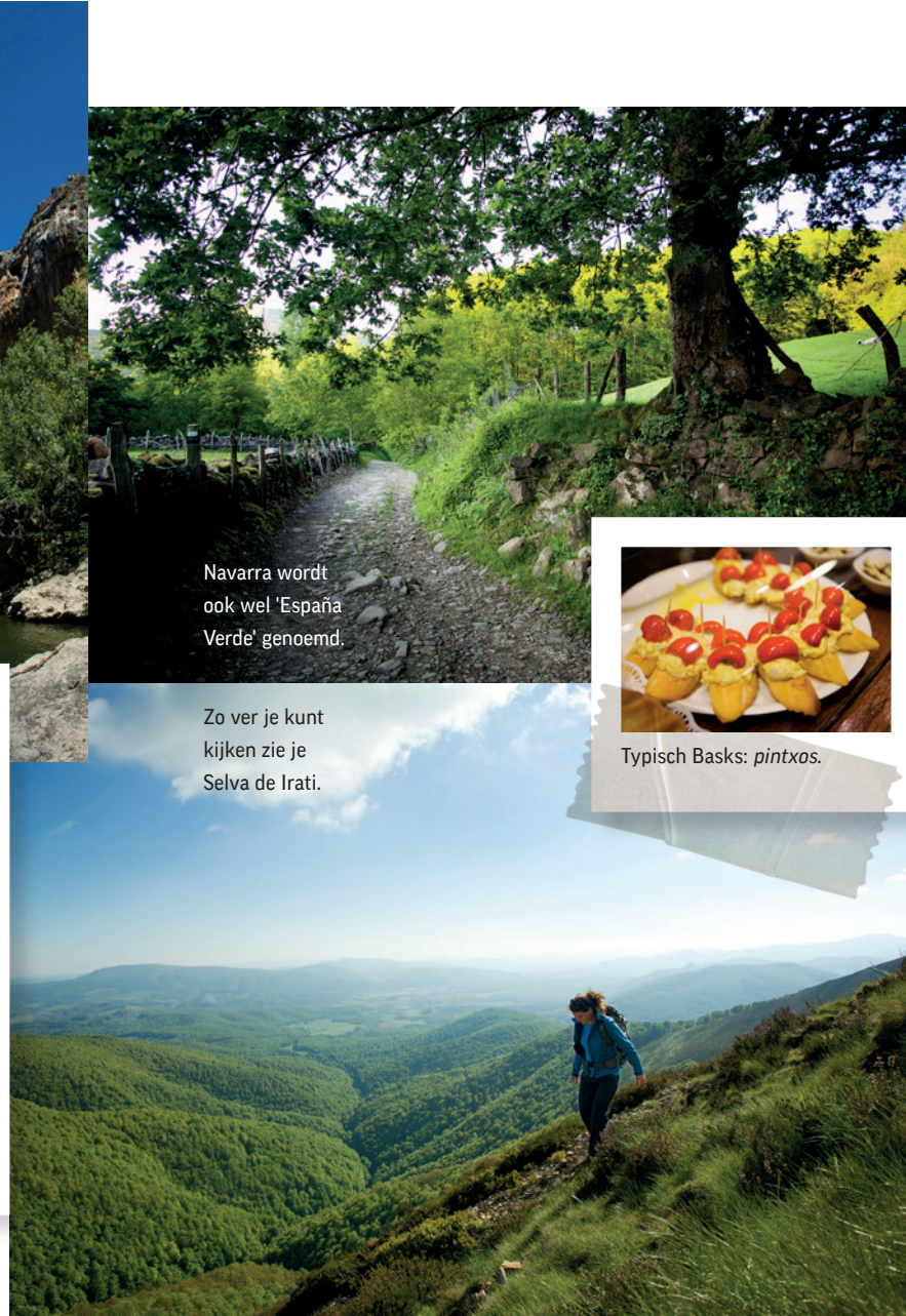
Navarra wordt ook wel 'España Verde' genoemd.

De laatste dag van de trip zien we dezelfde gieren maar nu van dichterbij. We maken een lange trektocht door het