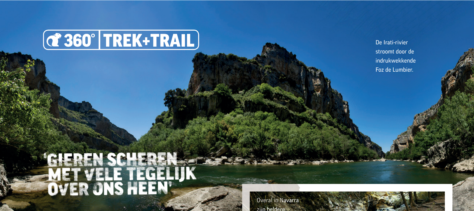
De Irati-rivier stroomt door de indrukwekkende Foz de Lumbier.